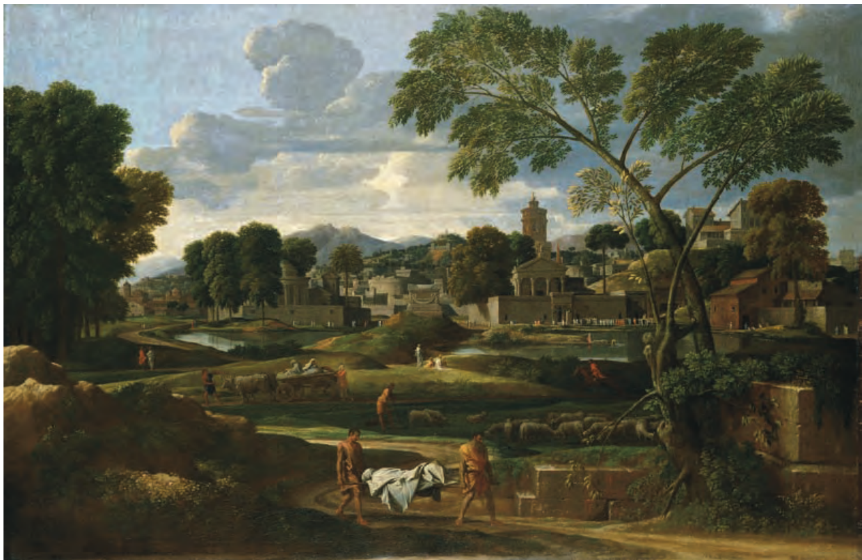
Atgynhyrchwyd gyda chaniatâd Iarll Plymouth, benthyciad hir dymor i Amgueddfa Genedlaethol Cymru.

Mae'r darlun hwn yn adrodd hanes arwrol dyn da, Phocion, a gafodd ei eni yn 402 CC. Roedd yn rhan allweddol o fywyd dinas Athen, ond cafodd ei gyhuddo ar gam o fradychu'r ddinas i'w gelynydd a'i ddedfrydu i farwolaeth. Oherwydd fod rhai'n ei gyhuddo o fod yn fradwr, gwaharddwyd ei gladdu o fewn muriau'r ddinas. Cyflogwyd dau ddyn i gludo'i gorff allan o'r ddinas, lle cafodd ei losgi'n ddiweddarach. Mae'r darlun hwn yn un o bâr. Mae'r llall yn Oriol Gelf Walker, Lerpwl, ac yn dangos menyw – gwraig Phocion mwy na thebyg – yn casglu'i lwch ac yn ei ddychwelyd i Athen.