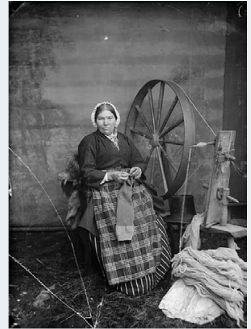
(LLUNIAU CASGLIAD Y WERIN)