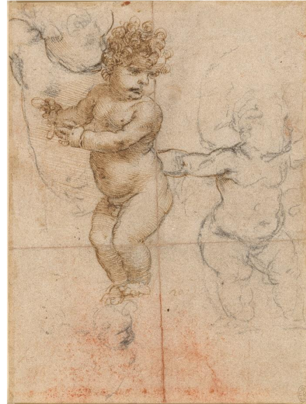
Leonardo da Vinci, Brasluniau o faban, tua 1504-8

Trafodwch deitl y darn. Beth mae teitlau yn eu dweud wrthym? Yw'r teitl yn ddefnyddiol ar gyfer dysgu mwy am y darn?