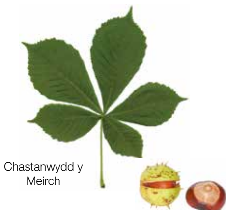
Chastanwydd y Meirch

Mae coed Castanwydd y Meirch ( Aesculus hippocastanum ) yn frodorol i dde-ddwyrain Ewrop ond fe'u cyflwynwyd i Brydain dros 300 mlynedd yn ôl. Mae'r blodau gwyn hufennog trawiadol yn ymddangos yn gynnar ym mis Mehefin ac yn darparu pail i lawer o bryfed. Dros y blynyddoedd diwethaf mae nifer o blâu a chlefydau wedi ymledu'n gyson drwy boblogaethau Castanwydd, ac mae hynny'n gallu bod yn niweidiol iawn.