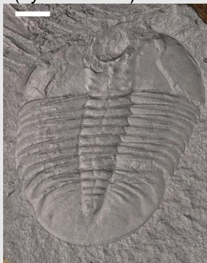
Homalopteon (hyd at 3.5cm)