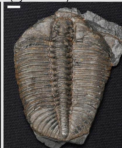
Platycalymene (hyd at 6cm)