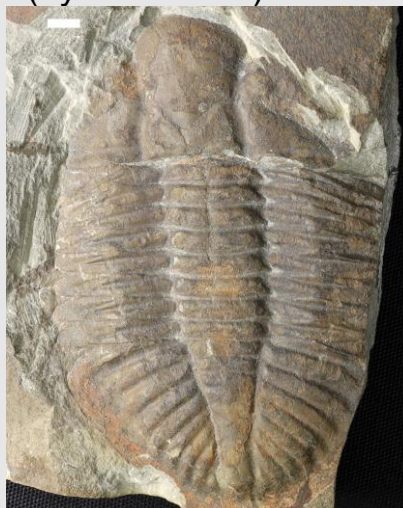
Oygginus (hyd at 11cm)