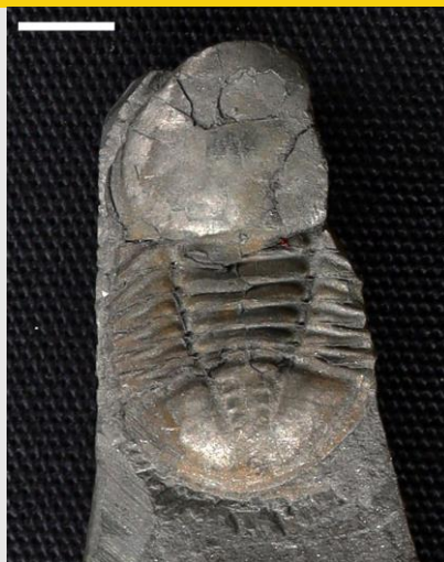
Degamella (hyd at 2.5cm)