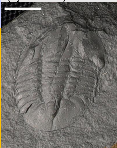
Barrandia (hyd at 2.5cm)