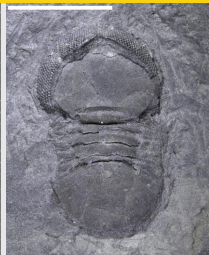
Microparia (hyd at 1cm)