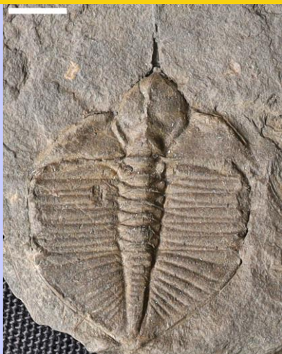
Cnemidopyge (hyd at 3cm)

Peidiwch morthwyllo'r clogwyni, neu unrhyw ffosilau mewn carreg soled.