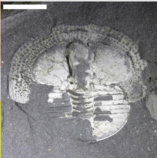
Whittardolithus (hyd at 1cm)

Peidiwch morthwyllo'r clogwyni, neu unrhyw ffosilau mewn carreg soled.