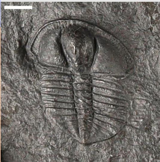
Botrioides (hyd at 1.5cm)

Teulu arbennig o drilobitau gyda ffrinj o gwmpas y pen yw trinucleiaid. Mae gan bob ffrinj resi o bantiau, fyddai'n cael eu defnyddio i synhwyro neu ffiltro bwyd, mwy na thebyg. Mae nifer a threfn y pantiau yn help i adnabod y gwahanol rywogaethau. Dim yn y cyfnod Ordoficaidd mae Trinucleiaid i'w gweld, ac mae sawl rhywogaeth i'w gweld yng Nghymru. Mae'r ffrinj wedi torri neu ei gladdu yn y graig gyda rhai ffosilau.