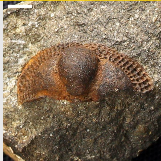
Broeggerolithus (hyd at 1cm)