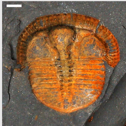
Trinucleus (hyd at 3cm)