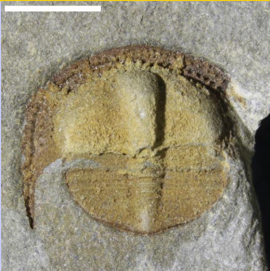
Bettonia (hyd at 1.5cm)

Craig Ordoficaidd yw mwyafrif y Canolbarth, yn dyddio o gyfnod pan oedd y tir yn ynysoedd folcanig yng nghanol cefnfor. Mae'r rhan fwyaf yn garreg laid neu siâl wedi'i ddyddodi ar wely'r môr rhwng yr ynysoedd. Tua 445 i 485 miliwn o flynyddoedd yn ôl oedd y cyfnod Ordoficaidd, ac mae'r trilobitau sydd i'w canfod mewn creigiau Ordoficaidd yng Nghymru yn dyddio o 460-470 miliwn o flynyddoedd yn ôl.