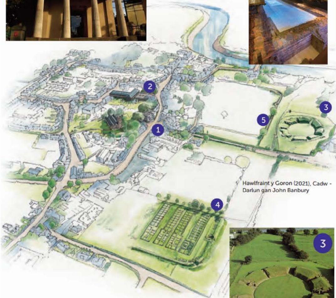
Hawlfraint y Goron (2021), Cadw - Darlun gan John Banbury