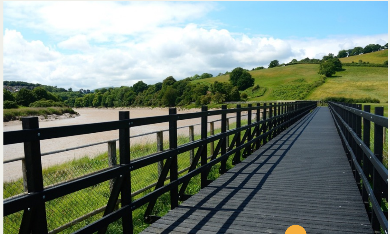
Golygfa o'r llwybr pren ger Caerllion