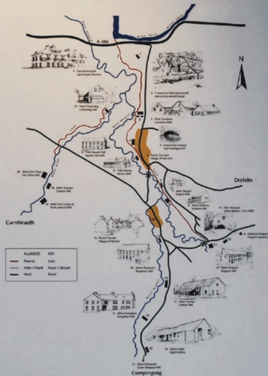
Rhan o rhwydwaith y pownd Part of the leat network

Collecting water in mill ponds overnight enabled mills to keep working all day, even if the river was running low. Water was steadily released into the man-made leat to power the water wheel or turbine. The water then returned to the river.